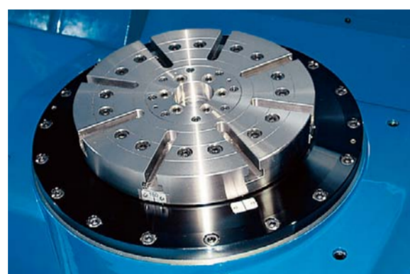
ø300 mm テーブル